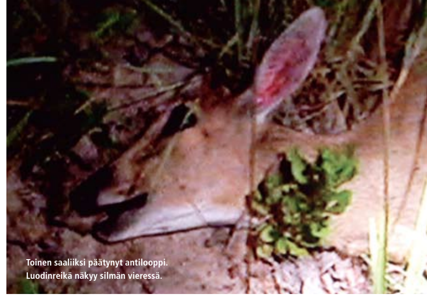
Toinen saaliiksi päättynyt antilooppi. Luodinreikä näkyy silmän vieressä.

Viisi minuuttia myöhemmin tapahtui jotain mieltä ylentävää. Sarastavan aamun saattelemana meitä lähestyi iloisesti puliseva joukko. Huutelu alkoi jo kaukaa. Toverini selitti, että hiekan ja Pajeron välillä käydyin taistelun äänet olivat kantaautuneet läheiseen kylään, ja joukko riensivät auttamaan meitä. Hienoa! Lisääntyneen työntövoiman ansiosta Pajero punnersi itsensä yli pehmeimmän hiekkakentän ja kaikki olivat tyttyväisiä. Jaoin kaikki taskuista ja repusta löytyneet kolikot apujoukoille. Siinä samalla vaihdoinme kuljettajan ja sain kömpiä takapenkille. Sekuntia myöhemmin olin unessa. Heräsin kolinaa ja rynkytykseen. Silmien avauduttua ymmärsin, että olimme saapuneet takaisin kylään josta lähdimme. Tuon kylän pääkatua koristaa asfaltti ja vanne kikkatti mukavasti sitä vasten. En malttanut olla avamatta ovea ja tarkastaa renkaan ulkonäköä. Näytti kuin vappuviuhka olisi pyörinyt sahalaitaisen metallikehän ympärillä. Kaarroidemme mökin pihaa ja keräsin vähäiset tavaran autosta. Kello oli viittä yli yhdeksän. Seuraavaksi oli väsyneiden retkeilijöiden aika sanoa hyvästi.