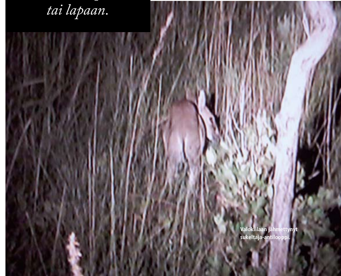
Valokiilaan jähmettynyt sukeltaja-antilooppi.

Omistaja nappasi pienoiskiväärin käsistäni ja esitteli sitä ylpeänä. Hän oli ampunut sillä vinon pinon antilooppeja tähdäten joko päähän tai lapaan.