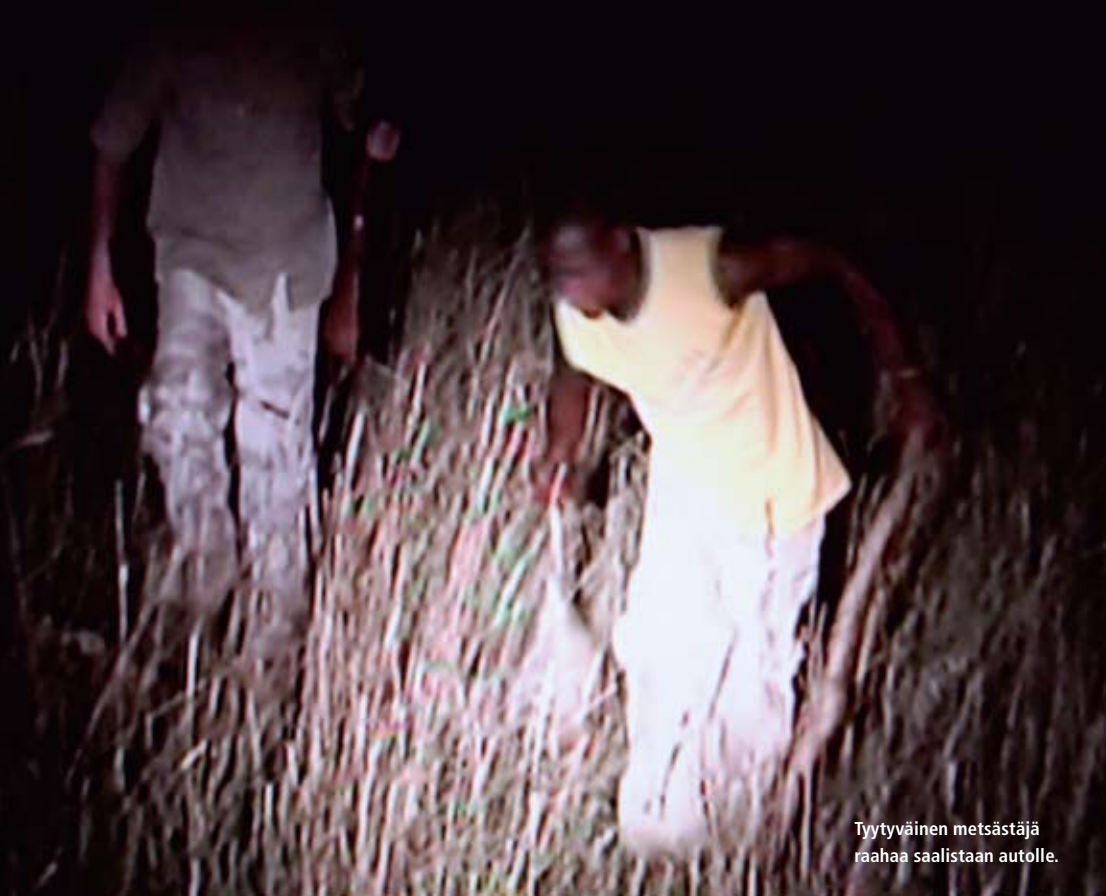
Tyttyväinen metsästäjä raahaa saalistaan autolle.

pari kertaa valokiilassa ja sitten suupielet levivät korviin onnistumisen merkiksi. Mies roikkotti kädessään aikuista sukeltaja-antilooppia ja kantoi sen autolle.