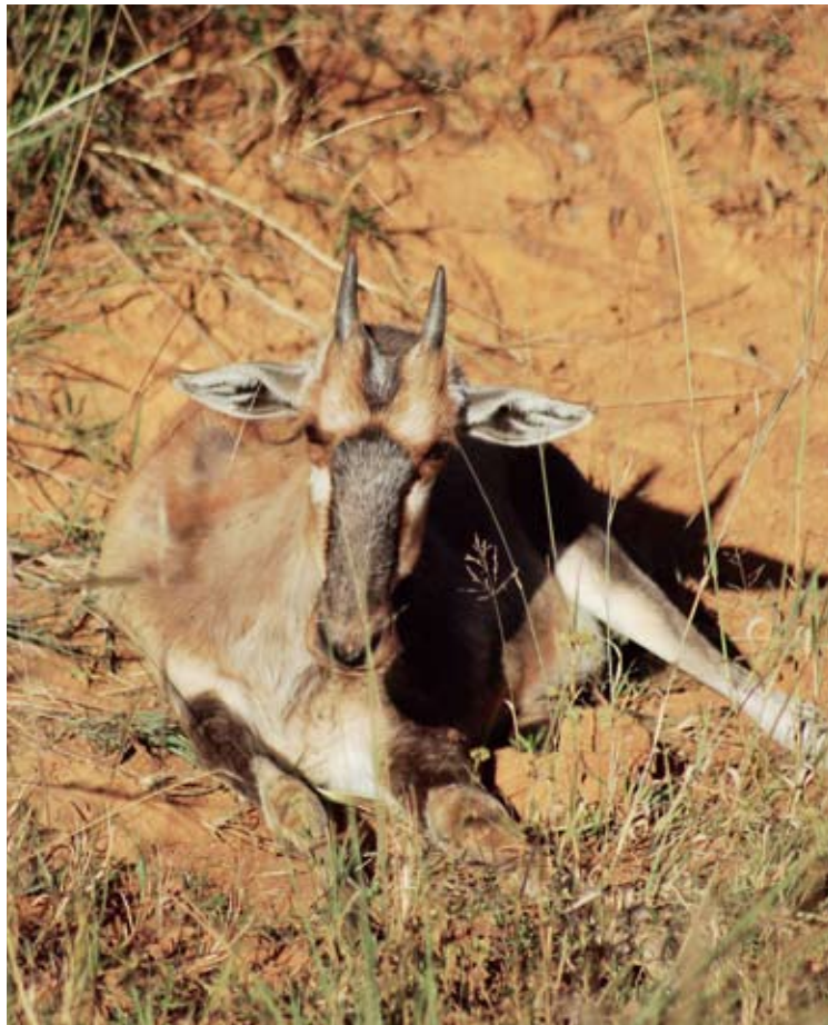
Punalehmäantiloopin vasa yritti piileskellä harvassa heinikossa. Oli helposti havaittavissa että kaikki ei ollut kohdallaan.