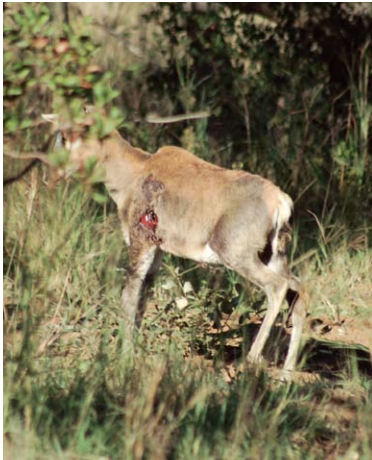
Karu totuus paljastui kun vasa nousi seisomaan. Antilooppi oli joutunut salametsästäjien uhriksi. Alueen valvoja lopetti eläimen kärsimykset.

paikoista roimat tuloerot ja ripakopallinen köyhyyttä.